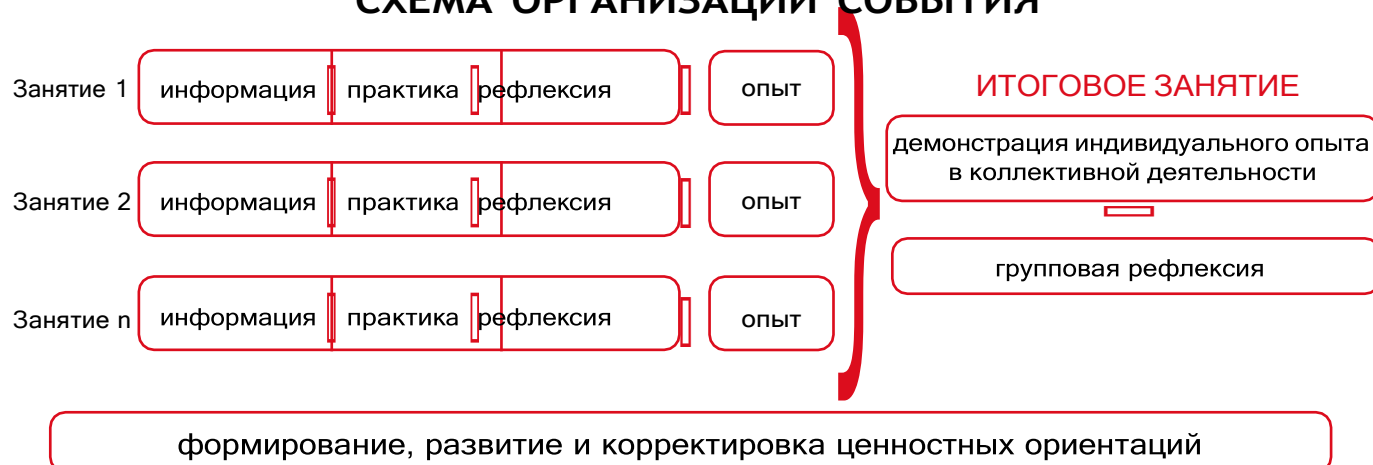
Рисунок 1 — Схема организации события

Таким образом, у пятиклассников происходит построение логической цепочки от собственного опыта проживания каждого занятия к ознакомлению с опытом других детей и к формированию общего отношения классного коллектива к прожитому ими событию.